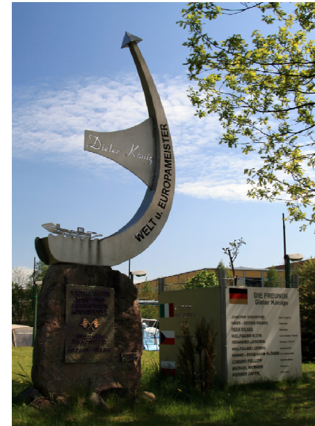
Denkmal für Dieter König Memorial of Dieter König