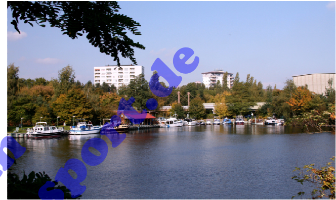
Hafen des MRC Berlin e.V. Harbour of MRC Berlin e.V.